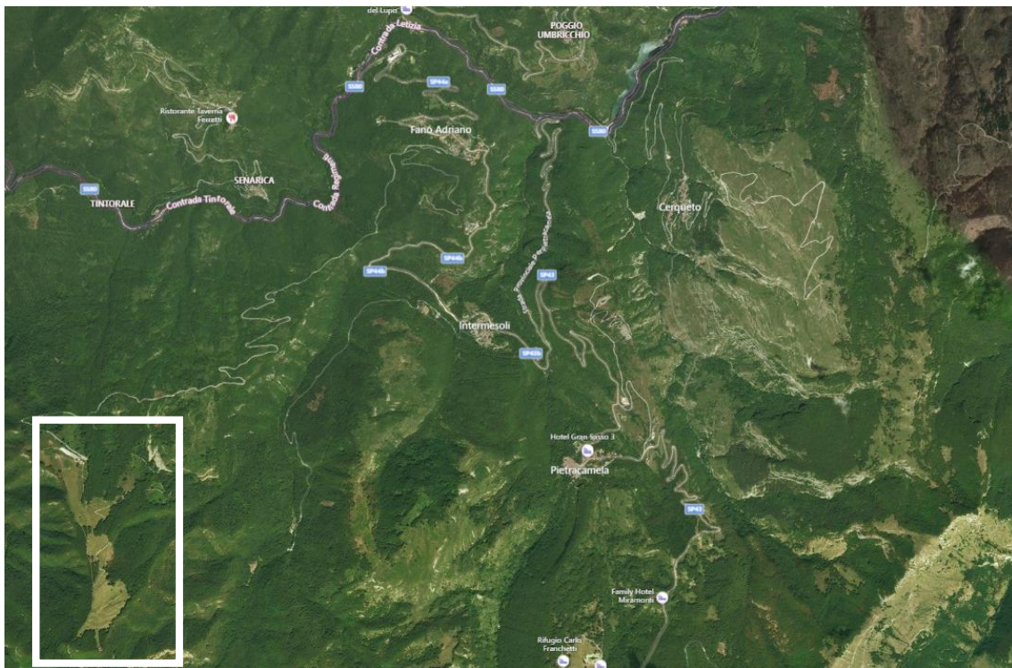
Ortofotocarta con individuazione intervento

L'area di intervento è localizzata nell'ortofoto sottostante.